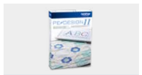
Software per ricamo