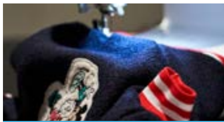
Cucito e ricamo