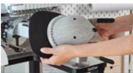
Macchine per ricamo professionale